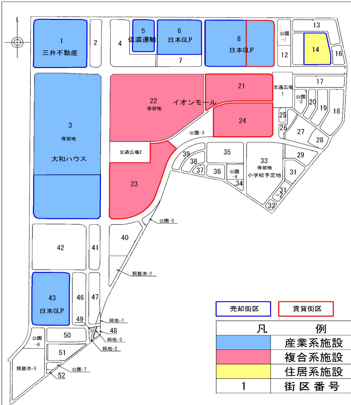
企業誘致予定箇所図（共同化利用街区/売却・賃貸）

なお、イオンモール（21～24街区）は、12月の土地の引渡しに向け、周辺の道路工事などを進めております。