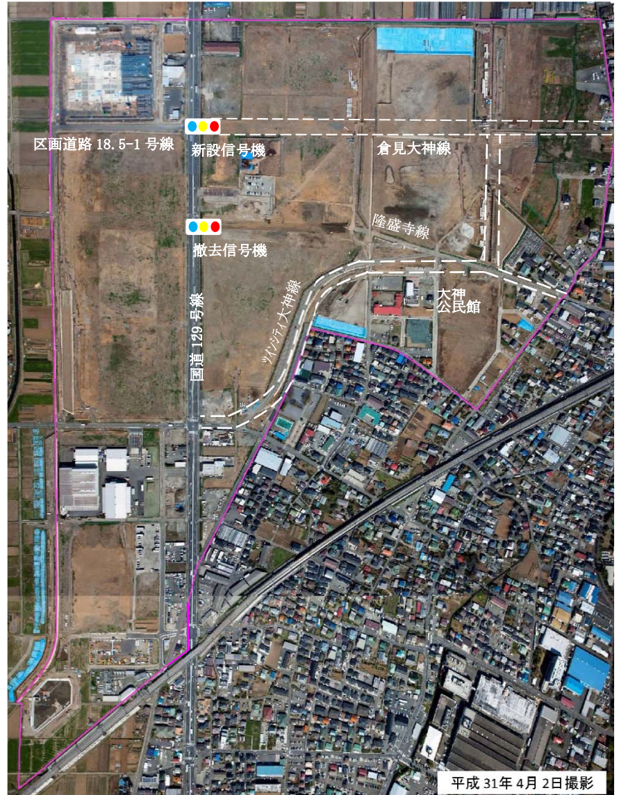
工事施工状況(写真)

今後とも円滑な事業推進に向け、役員一同、誠心誠意、努力してまいりますので、組合員の皆様のご理解、ご協力を宜しくお願いいたします。