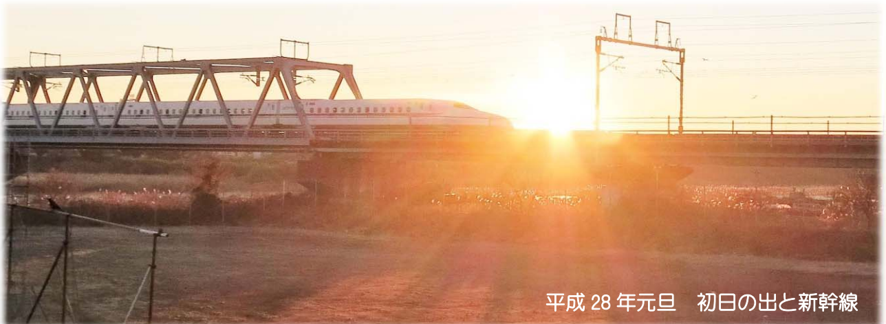
平成 28 年元旦 初日の出と新幹線